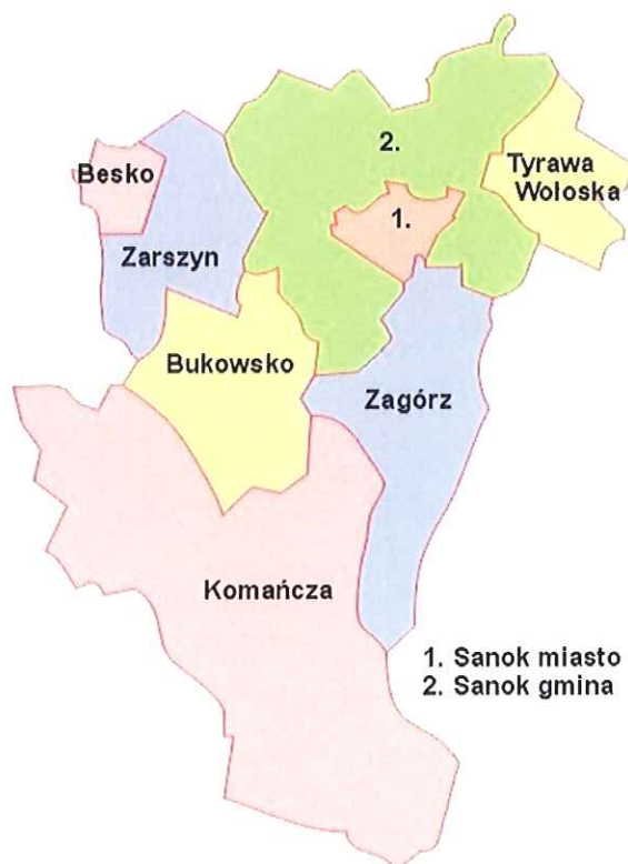
Rysunek 1. Gmina Komańcza w powiecie Sanockim

Gmina zajmuje obszar 456 km 2 , co stanowi ok. 37% powierzchni powiatu. Według danych z 2014 roku Gmina liczy 4 991 mieszkańców, a gęstość zaludnienia to w przybliżeniu 11 osób/km 2 . Siedziba Jednostki położona jest o 110 km na południe od Rzeszowa. Gmina Komańcza sąsiaduje z następującymi gminami: Baligród, Bukowsko, Cisna, Jaśliska, Rymanów, Zagórz. Od południa gmina graniczy z Republiką Słowacką.